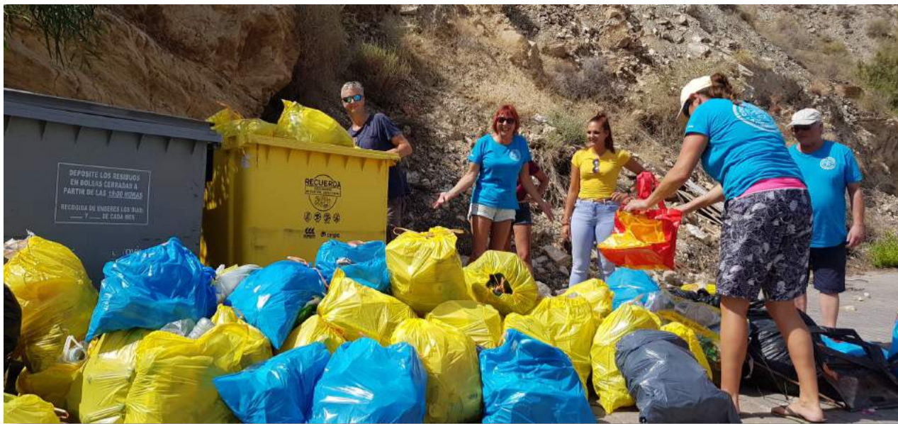
Actividades de concienciación y de amor al entorno y los animales. Arriba, limpieza de los alrededores del Canal de Remo. Abajo, algunas de las instantáneas que regaló el Concurso Canino en la Nave Polivalente.