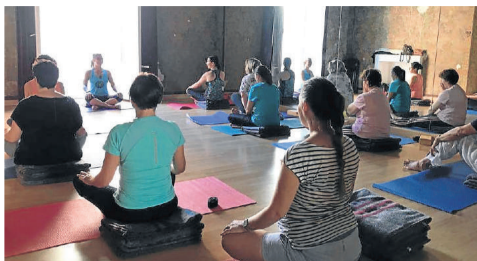
El Yoga ha sido otra de las actividades que ha atraído la atención del público.