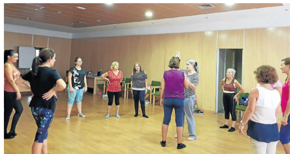
Bodanza para divertirse y cuidar la mente.