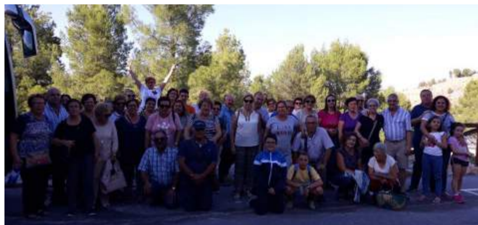
Viaje al Balneario de Zújar.