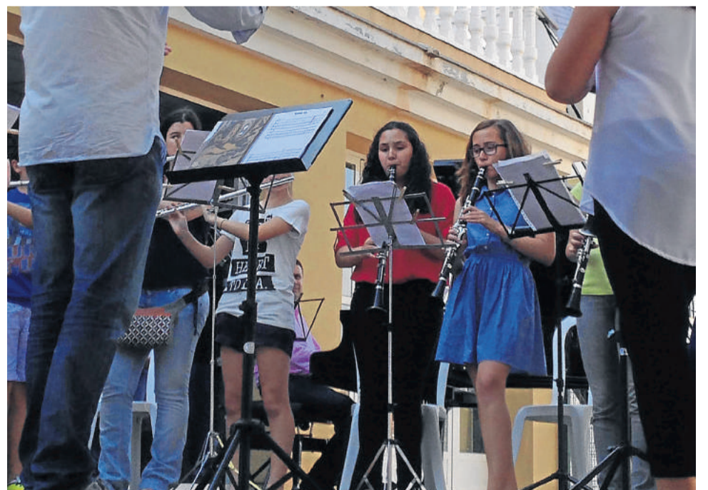
Encuentro de Conservatorios de Música en Cuevas del Almanzora.

Cuevas está de enhorabuena en el ámbito de la educación y de las enseñanzas artísticas de música y danza.