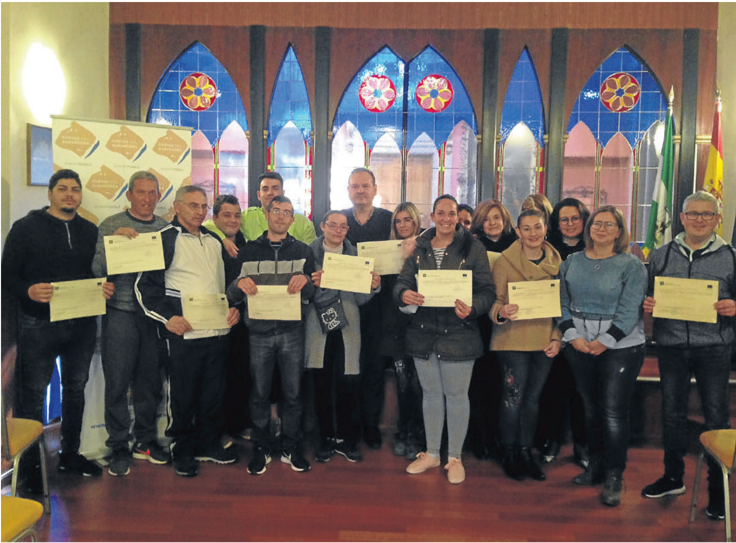
Entrega de certificaciones de Planes de Empleo anteriores llevados a cabo en Cuevas. A la derecha, Lanzadera de Empleo y taller de empleo de jardinería.