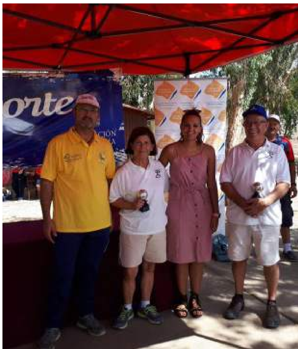
Campeonato Provincial de Petanca en Cuevas.