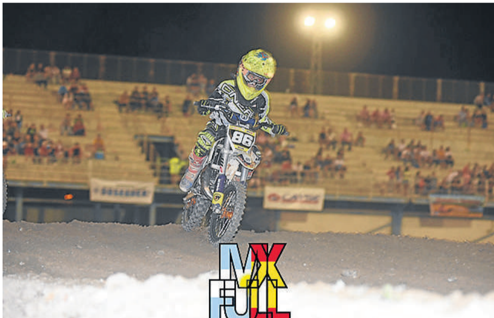
Auténtico espectáculo en las carreras en el Circuito de la Bonil.