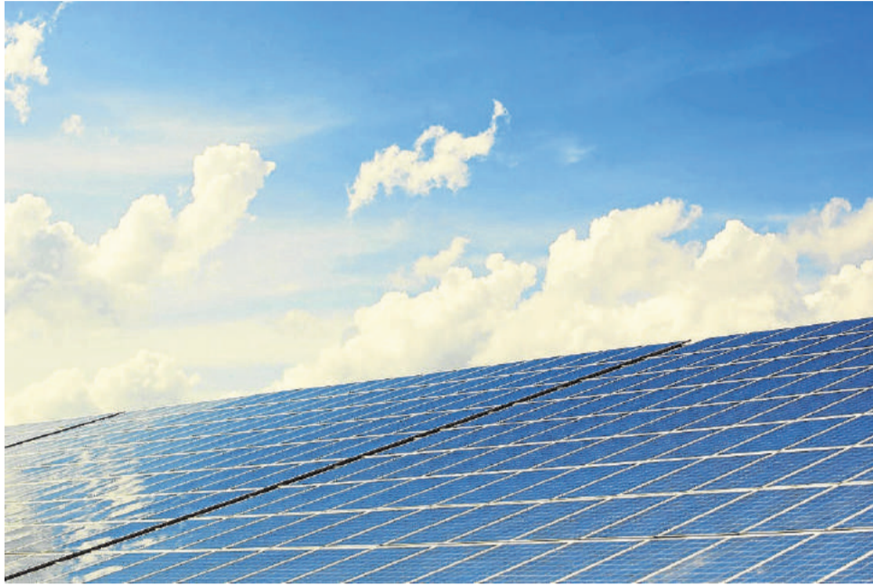
Placas solares serán una de las alternativas energéticas que se usarán en Cuevas del Almanzora.

El Ayuntamiento ha presentado actuaciones para renovar la iluminación pública y para arreglar los problemas de la piscina cubierta..