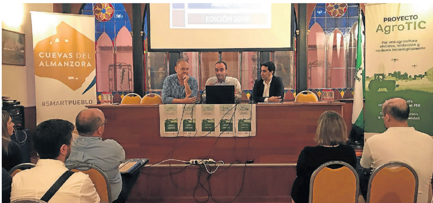
Jornada de ponencias para clausurar el proyecto Agrotic en Cuevas.

El fin, hacer más sostenible y moderna la industria agroalimentaria.