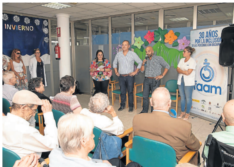
Jornadas de puertas abiertas con el Alzheimer como protagonista en el Centro de Día cuevano.