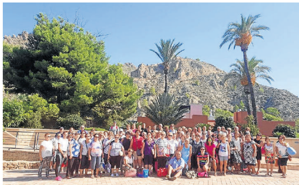
Viaje al balneario de Archena.