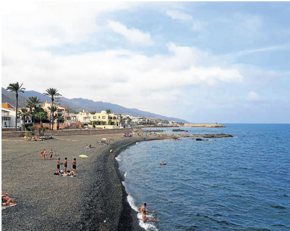
La costa villariquera a finales de este verano.

Cuevas del Almanzora ha visto aumentar un año más el número de visitas en este verano. Así se desprende los datos que se han podido recabar en la Oficina de Turismo y el Punto de Información Turística del Castillo de Villaricos.