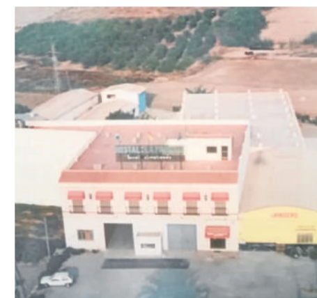
Las dos naves con el hotel en 1989.

tradicional, y con el sabor de siempre, con el gusto a las especiales noches de verano, de brisa, de buena gastronomía y de ratos de buena mesa y compañía bajo las parras, que le valen su denominación, a La Parra.