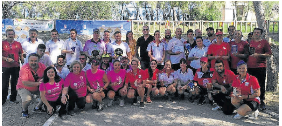
Foto de familia de la celebración del Campeonato de Petanca.

138 jugadores y más de 300 personas llegadas de toda la geografía nacional se dieron cita en el Parque del Vivero para disfrutar del X Campeonato Nacional de Petanca en Cuevas del Almanzora.