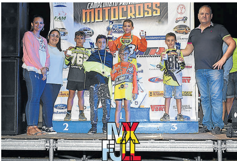
Podio de los más pequeños del Campeonato de Motocross Provincial.