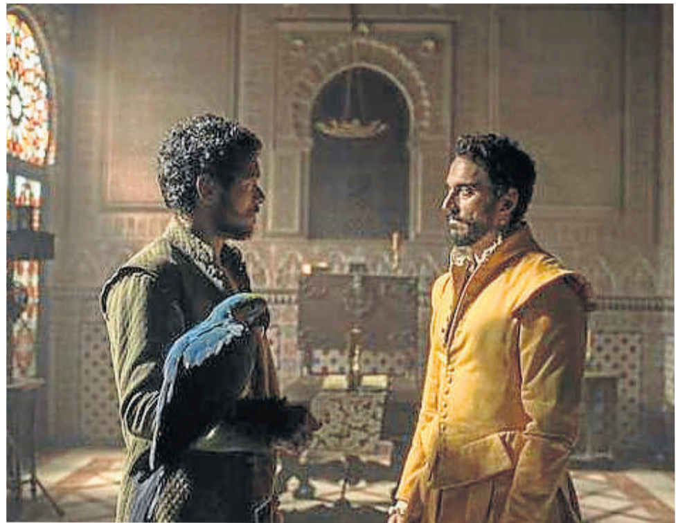
Una escena de la serie La Peste en su primera temporada.

esta nueva entrega se sitúa cinco años después de la última gran epidemia de peste, momento en el que Sevilla ha conseguido reponerse. La ciudad sigue manteniendo el monopolio del comercio con las Indias y su prosperidad va en aumento, pero también la población que se dispara alcanzando unos máximos históricos. El gobierno no es capaz de alimentar a sus habitantes ni de asegurarles unos servicios asistenciales mínimos. El descontento social crece y se cristaliza en el nacimiento de la Garduña, el crimen organizado, el hampa, que ha tomado el control de la ciudad.