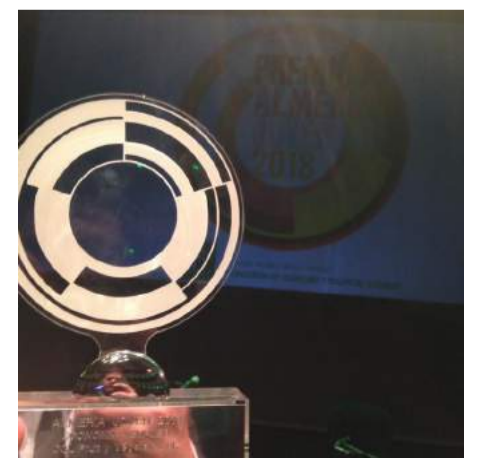
Trofeo Almería Joven 2018