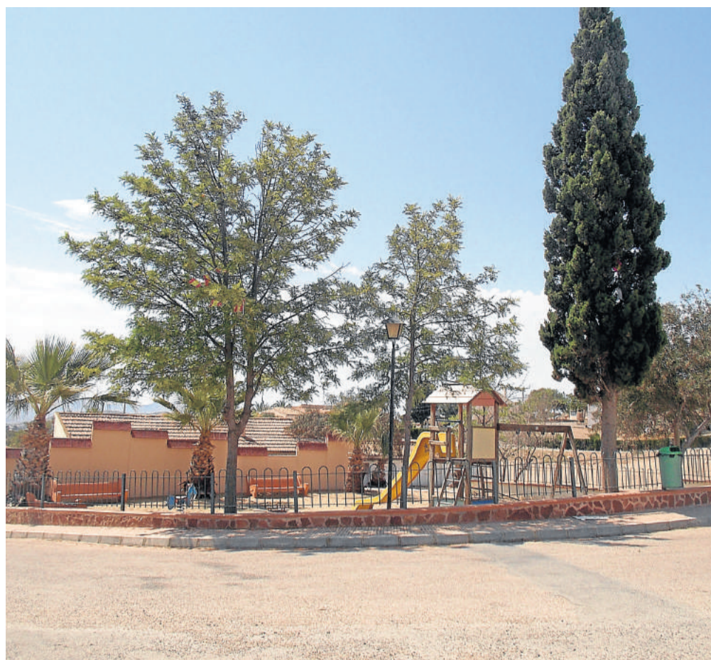
Parque Infantil en el término municipal de Cuevas del Almanzora.