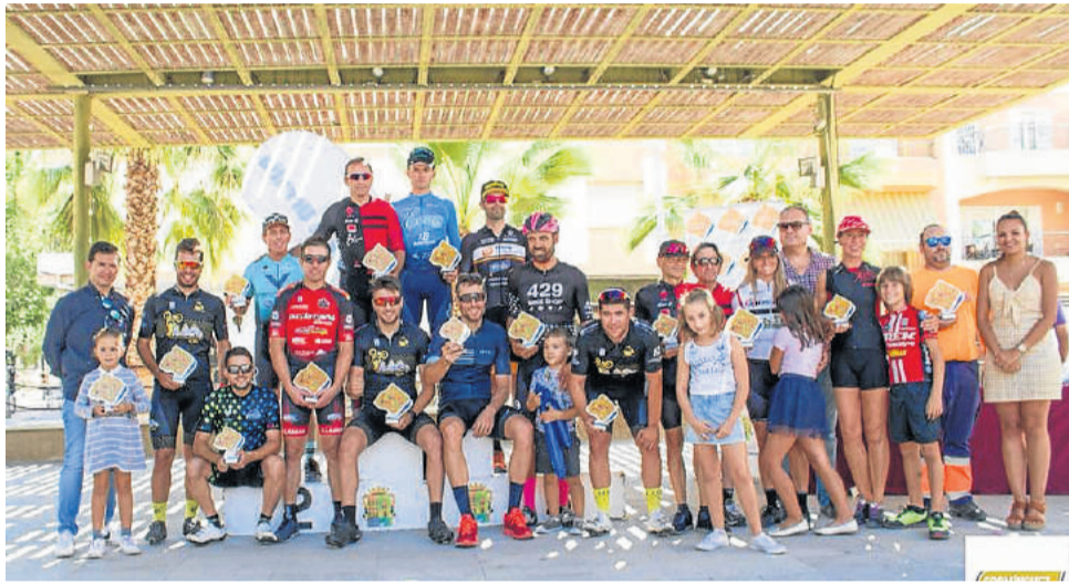
Vencedores de distintas categorías en la II Carrera Ciclista Urbana

Dos citas este mes vinculadas a las dos ruedas. El Campeonato Provincial de Motocross se celebró en el Circuito de La Bonil después de su aplazamiento anterior, con buena asistencia de público y un excelente trabajo del Motoclub Bajo Almanzora. La cita ciclista con la II Carrera Urbana congregó a más de 70 corredores en un ambiente de deportividad y de ganas de disfrutar del deporte al aire libre.