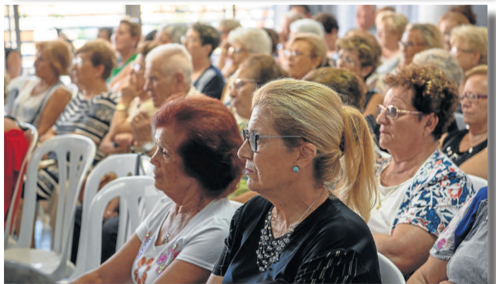
Las jornadas de puertas abiertas del Centro de Día contaron con una charla sobre el Alzheimer, pero también con la alegría de la Escuela de Música, Danza y Teatro.